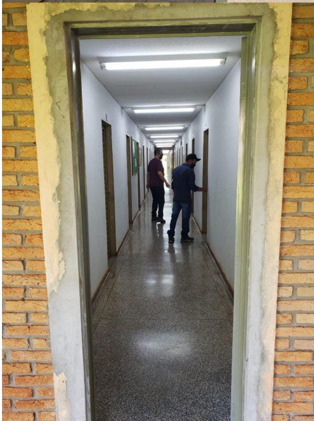
Sala dos professores FCA, sem medidas de biossegurança.