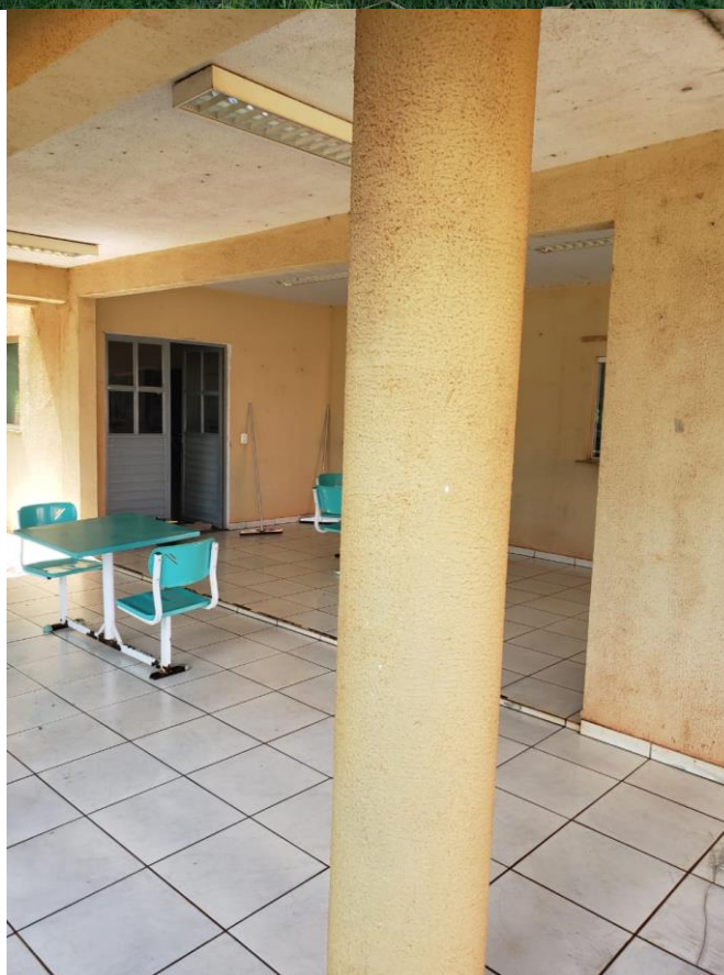
ITES – fechado, sem medidas de biossegurança.