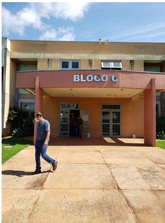
Bloco C – aberto, sem medidas de biossegurança.