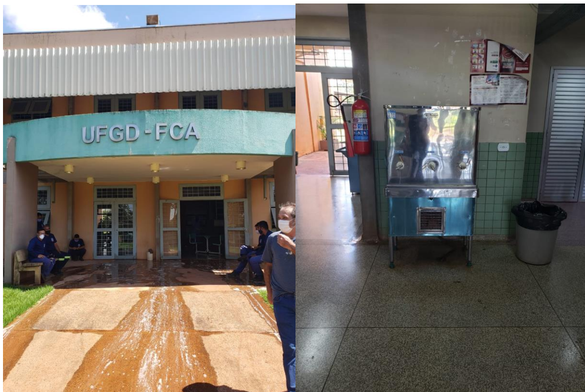
FCA – aberto, sem medidas de biossegurança.

CEREST- Centro Regional de Referência em Saúde do Trabalhador Av. Weimar Gonçalves Torres, 4225, Jardim Caramuru CEP:79.830-020 – Dourados/MS – Fone: (67) 3428-2494 / (67) 9.8468-8297 cerest.sems@dourados.ms.gov.br