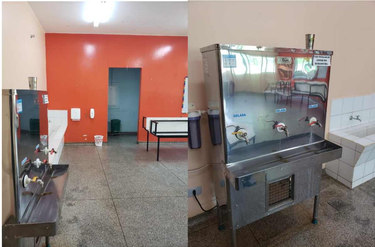
Bebedouro do CEI.

CEREST- Centro Regional de Referência em Saúde do Trabalhador Av. Weimar Gonçalves Torres, 4225, Jardim Caramuru CEP:79.830-020 – Dourados/MS – Fone: (67) 3428-2494 / (67) 9.8468-8297 cerest.sems@dourados.ms.gov.br