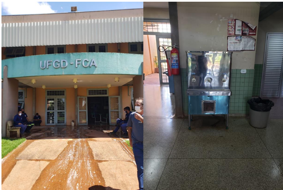
Prédio da FCA- aberto sem medidas de biossegurança.

CEREST- Centro Regional de Referência em Saúde do Trabalhador Av. Weimar Gonçalves Torres, 4225, Jardim Caramuru CEP:79.830-020 – Dourados/MS – Fone: (67) 3428-2494 / (67) 9.8468-8297 cerest.sems@dourados.ms.gov.br