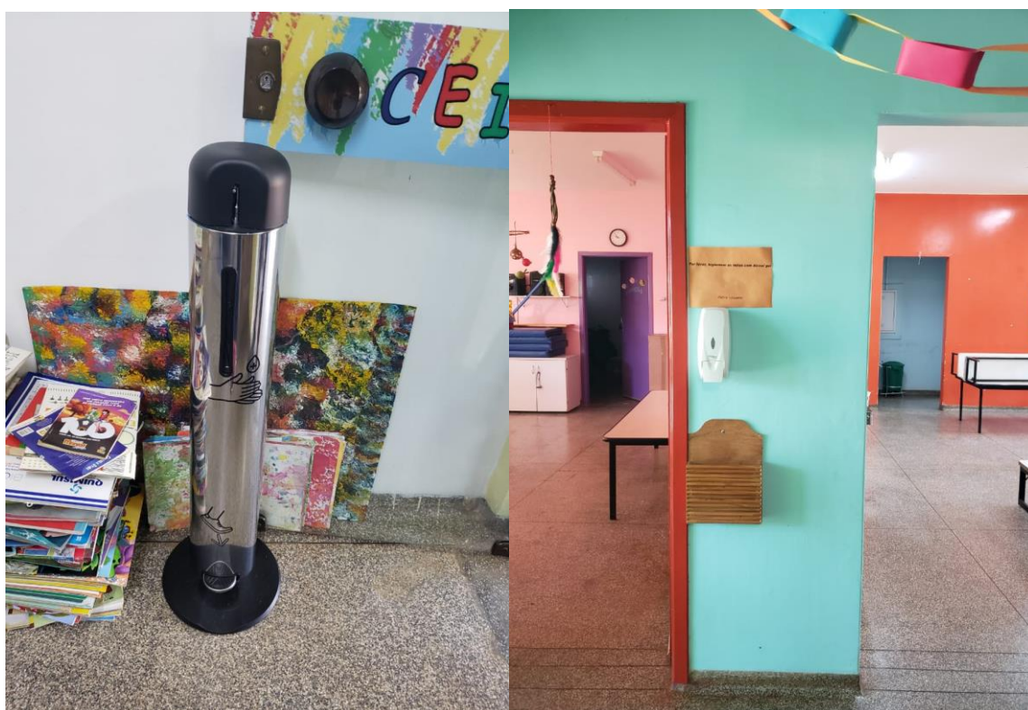
CEI – aberto, com medidas de biossegurança.