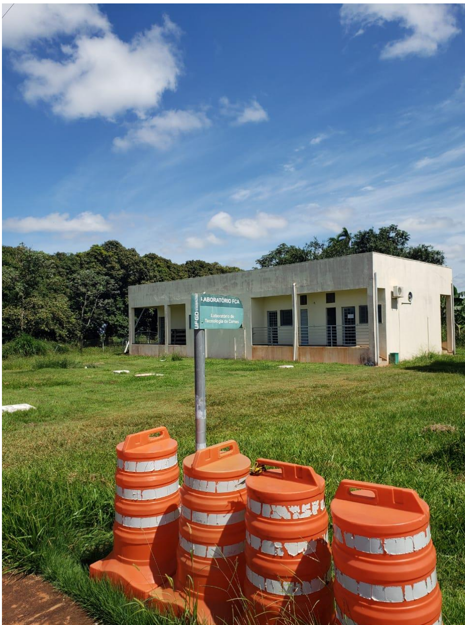
Laboratório da FCA – fechado, sem medidas de biossegurança

CEREST- Centro Regional de Referência em Saúde do Trabalhador Av. Weimar Gonçalves Torres, 4225, Jardim Caramuru CEP:79.830-020 – Dourados/MS – Fone: (67) 3428-2494 / (67) 9.8468-8297 cerest.sems@dourados.ms.gov.br