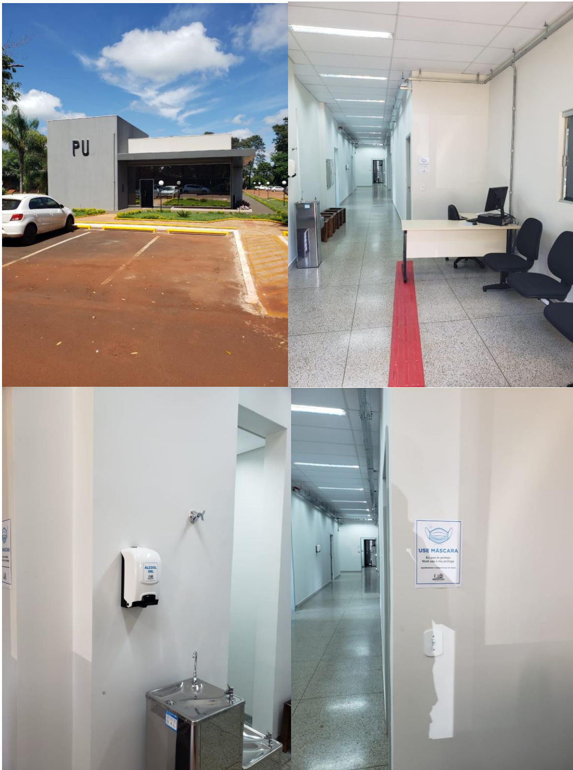
PU – aberto, com medidas de biossegurança.

CEREST- Centro Regional de Referência em Saúde do Trabalhador Av. Weimar Gonçalves Torres, 4225, Jardim Caramuru CEP:79.830-020 – Dourados/MS – Fone: (67) 3428-2494 / (67) 9.8468-8297 cerest.sems@dourados.ms.gov.br