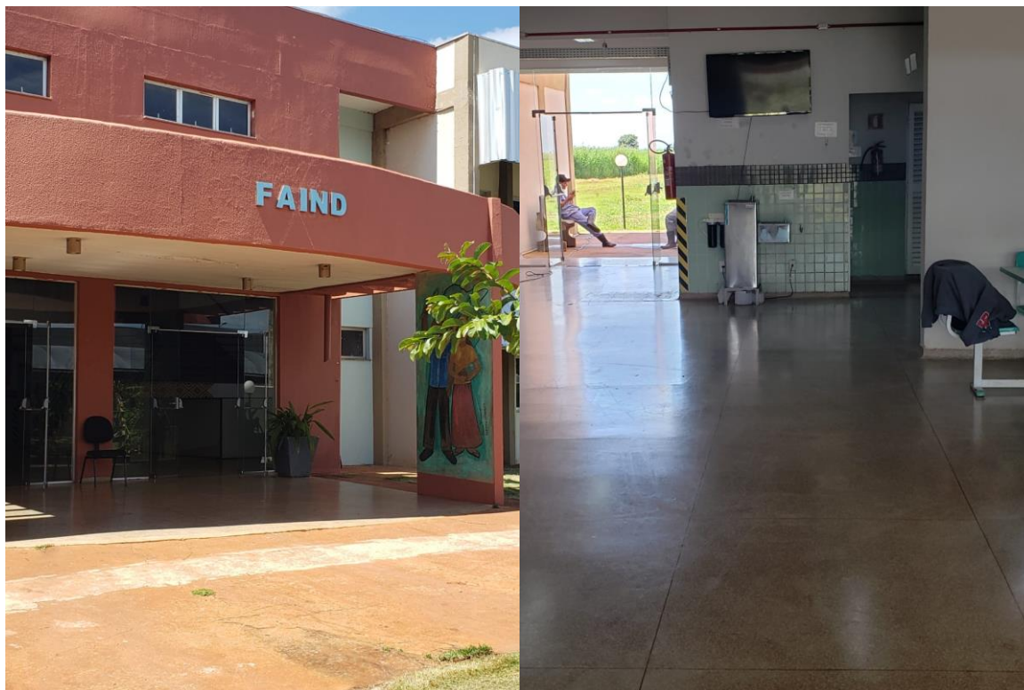
FAIND – aberto, sem medidas de biossegurança.

CEREST- Centro Regional de Referência em Saúde do Trabalhador Av. Weimar Gonçalves Torres, 4225, Jardim Caramuru CEP:79.830-020 – Dourados/MS – Fone: (67) 3428-2494 / (67) 9.8468-8297 cerest.sems@dourados.ms.gov.br